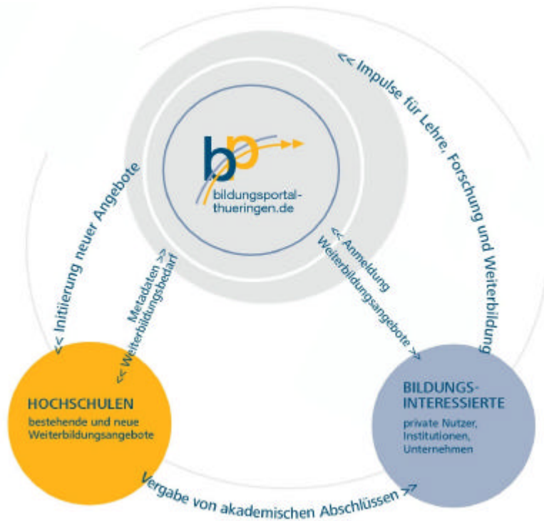
Abbildung 1: Vermittlerfunktion des Bildungsportals Thüringen

Um den Nutzern eine schnelle effiziente Suche gemäß ihren Interessen zu ermöglichen, müssen die Bildungsinhalte in den Metadatenstrukturen sachgerecht dargestellt werden. Hierin liegt die eigentliche Herausforderung für das Projekt. Neben dem Nutzer wird auch dem Anbieter von Lehrinhalten durch eine schnelle, zielgenaue Suche eine hohe Transparenz über vorhandene aktuelle Angebote ermöglicht. Eine Initiierung neuer Angebote bezüglich einer definierten Nachfrage wird angestrebt. Das Projekt ermöglicht somit eine Kompetenzbündelung für den Hochschulstandort Thüringen. Abbildung 1 verdeutlicht diesen Ansatz und zeigt die Vermittlerrolle des Bildungsportals Thüringen.